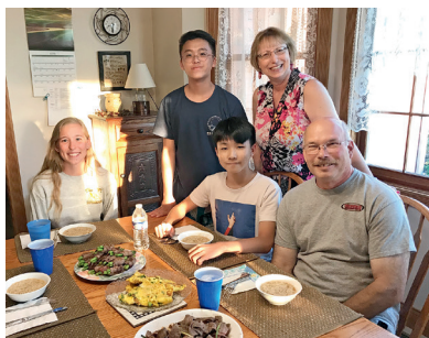
學校以往每年均舉辦交流活動，安排學生到美國交流，入住寄住家庭，體驗當地生活。

馬中作為基督教學校，不少服務當然與宗教有密切關係。校董黃信榮牧師表示，疫情爆發前，辦學團體每年會安排數十名來自美國的教友訪港，跟校內學生交流，並由學生負責接待，一同遊覽香港及尋找美食。過程中，學生可學習跟不同文化背景的人士相處和溝通，同時鍛煉英語會話。受疫情影響，近兩年改以視像形式進行，但仍有逾千中小學生參與，「馬中的中一至中三學生，與美國的教友一起敬拜、分享聖經故事、做手工、玩遊