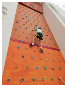
學生在常規攀石課堂中，實踐堅毅價值。

引入新興的體育運動項目，培養學生的興趣和潛能。項目包括帆船、高爾夫及板球等，將會在遊艇會及頂級球場等場地內進行訓練，並由外籍教練以英語任教。「運動可訓練學生的專注力及強健體魄，也可培養堅毅意志，以英語教學更有助提升學生的英語水平。」另外，校內正在興建具規模的健身室和帶氧運動訓練中心，日後學生可經常使用，藉以鍛煉身體，建立恒常運動習慣。