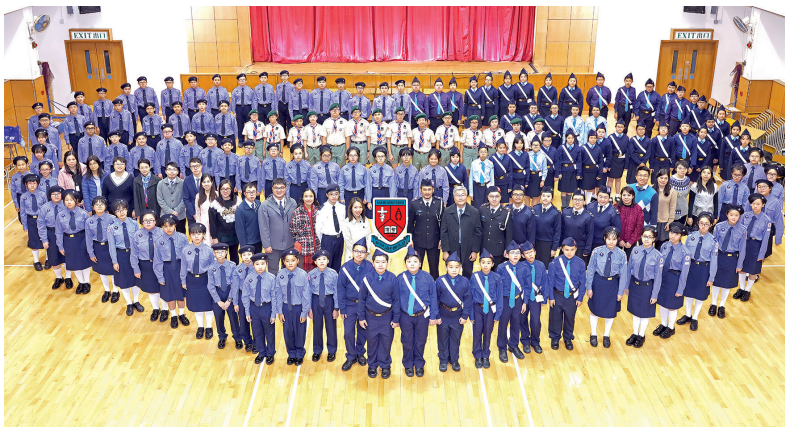
校內成立了多支制服團隊，讓學生通過訓練，培養紀律和正面價值觀。

請名人、專家或校外團體代表，以講座或話劇等形式分享與價值觀相關的議題，如禁毒與性教育等；同時也有參觀活動，如探訪懲教所等，讓學生學習守法的重要性。 馬中價值教育的最特別之處，當數校內的爬蟲館，內有三十多種爬蟲，包括蟒蛇、龜、蜥蜴等。爬蟲館由經過考核的30多名學生負責打理，高年級學生擔