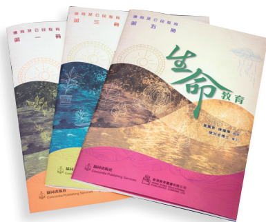
學校使用由辦學團體製作的校本生命教育教材。

請名人、專家或校外團體代表，以講座或話劇等形式分享與價值觀相關的議題，如禁毒與性教育等；同時也有參觀活動，如探訪懲教所等，讓學生學習守法的重要性。 馬中價值教育的最特別之處，當數校內的爬蟲館，內有三十多種爬蟲，包括蟒蛇、龜、蜥蜴等。爬蟲館由經過考核的30多名學生負責打理，高年級學生擔